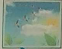
ЛЕТЯТ С ЮГА